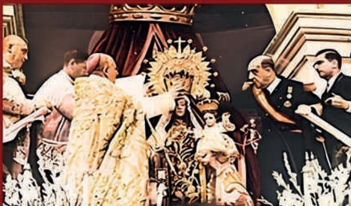
Coronación de la Virgen del Carmen en Chile, un hito religioso central que ocurrió el 19 de diciembre de 1926 en el Parque Cousiño.

(Recordemos brevemente que el escapulario es un signo por el cual se manifiesta que la Virgen custodia al fiel que lo lleva con fe y amor, y es un signo de esperanza en la salvación eterna).