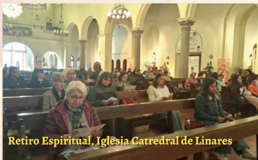
Retiro Espiritual, Iglesia Catedral de Linares

Especialmente significativa fue la activa participación de niños y jóvenes en las representaciones del Vía Crucis, donde, con compromiso y creatividad, dieron vida a los momentos de la Pasión del Señor. A través de sus gestos y expresiones, ayudaron a toda la comunidad a contemplar más profundamente el misterio del amor de Cristo, convirtiéndose en verdaderos testigos y protagonistas de la fe.