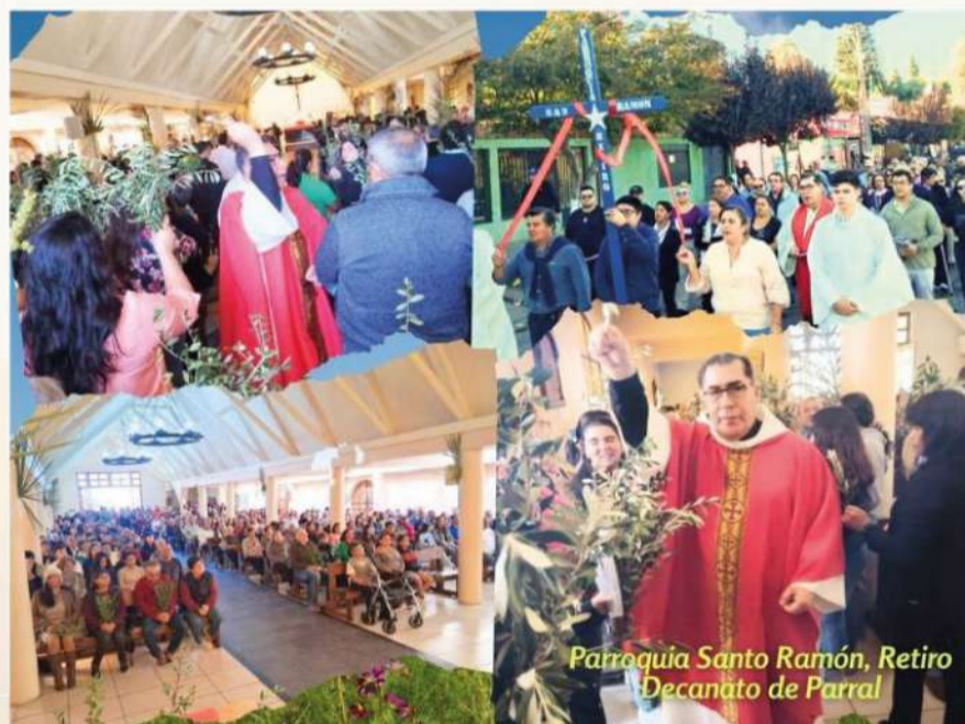
Parroquia Santo Ramón, Retiro Decanato de Parral

En cada rincón de la Diócesis de Linares, la Semana Santa fue vivida con profundidad y entrega por comunidades llenas de fe. Niños, jóvenes, adultos y ancianos se reunieron, tanto en sectores urbanos como rurales, para recorrer juntos el camino del Señor, desde la esperanza del Domingo de Ramos hasta la alegría renovadora de la Resurrección.