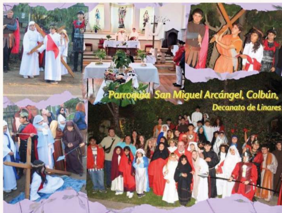
Parroquia San Miguel Arcángel, Colbún, Decanato de Linares