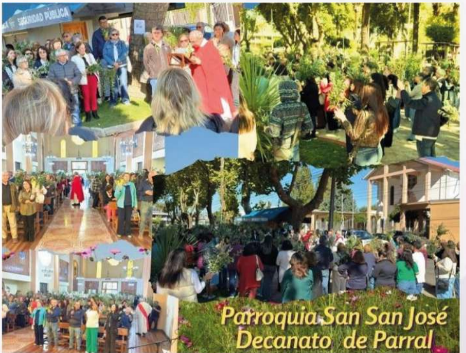
Parroquia San José Decanato de Parral

Así, en cada rincón de nuestra Diócesis, la fe se hizo vida, comunidad y esperanza compartida.