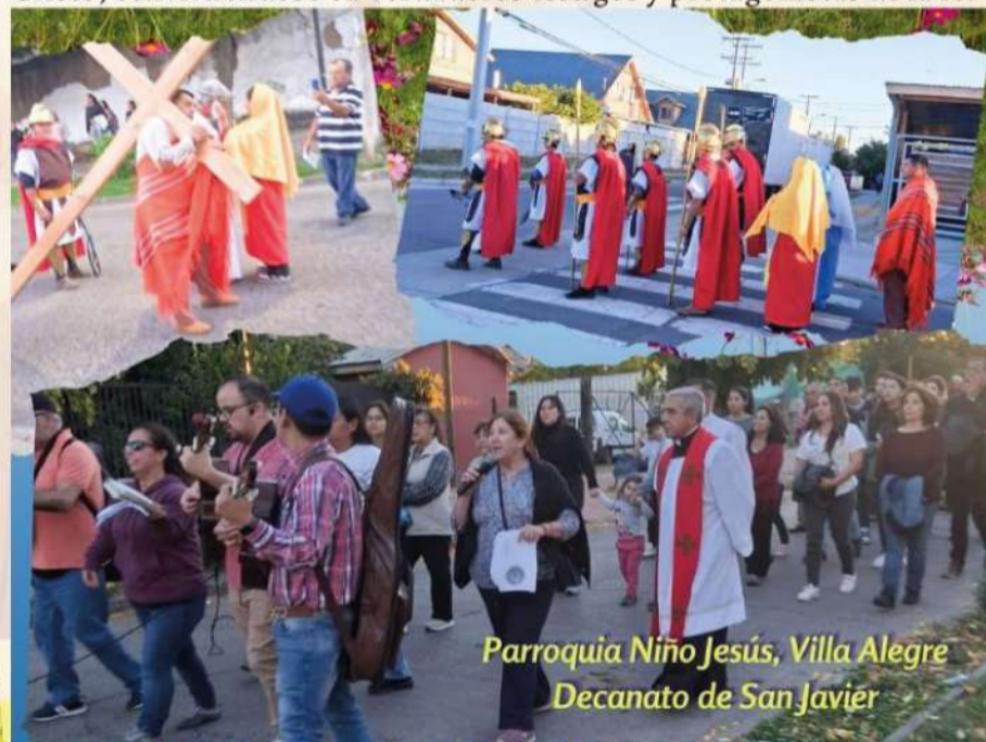
Parroquia Niño Jesús, Villa Alegre Decanato de San Javier