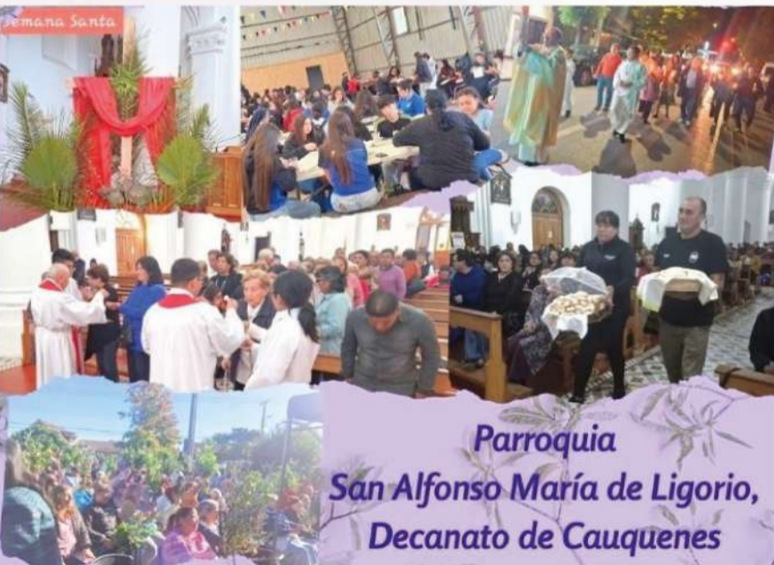
Parroquia San Alfonso María de Ligorio, Decanato de Cauquenes

Cada gesto, cada liturgia y cada encuentro reflejaron una Iglesia viva, que camina unida y que hace presente el amor de Cristo en medio de su pueblo. Especialmente significativo fue ver a los niños integrarse con entusiasmo, incluso a través de signos cercanos como el conejito de Pascua, que ayudó a transmitir la alegría del Cristo resucitado de una manera sencilla y familiar.