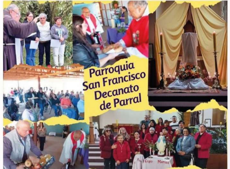
Parroquia San Francisco Decanato de Parral

La participación de los niños, con signos sencillos, hermosas representaciones y todos llenos de alegría, nos recuerda que la fe también se transmite con gestos cotidianos y cercanos. Esos signos que muchas veces nos recuerdan a la abuelita, a las y los tíos, a algunos padrinos también. Una fe transmitida, que compartida se fortalece y sigue creciendo.