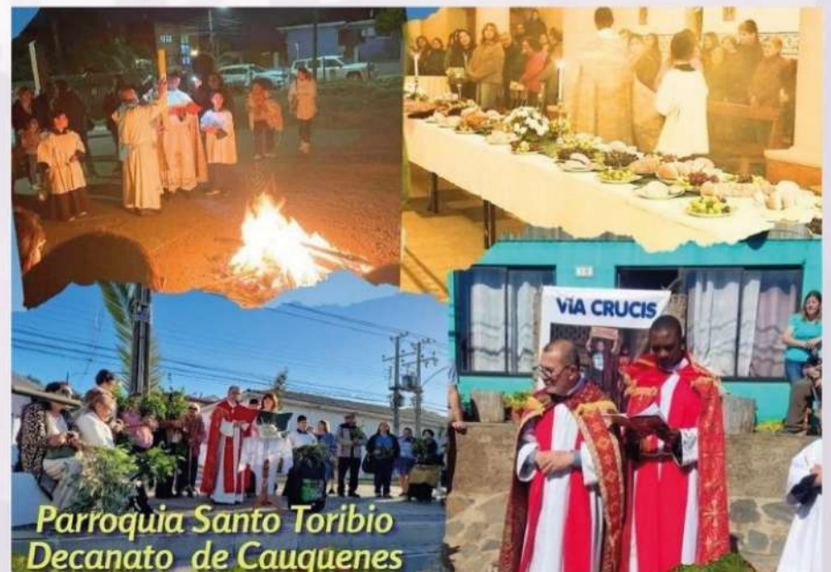
Parroquia Santo Toribio Decanato de Cauquenes

Que lo vivido en esta Semana Santa sea el impulso para salir, encontrarnos y anunciar, con renovado entusiasmo, que Cristo vive y camina con nosotros.