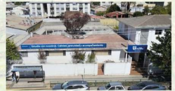
CFT San Agustín, educación que transforma, una nueva puerta al futuro se abrió en Constitución

Con más de 37 años de trayectoria, el CFT San Agustín continúa fortaleciendo su misión educativa en la Región del Maule, poniendo sus capacidades al servicio de la dignidad de las personas y del desarrollo integral de la sociedad. Esta nueva sede en Constitución se convierte así en un signo concreto de esperanza, donde la educación se proyecta como camino de transformación personal y comunitaria.