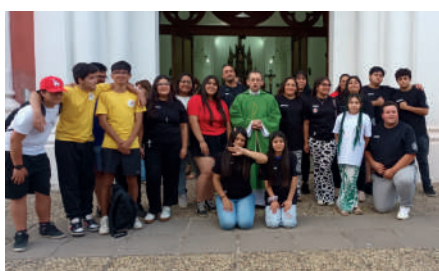
Grupo juvenil P. San Alfonso