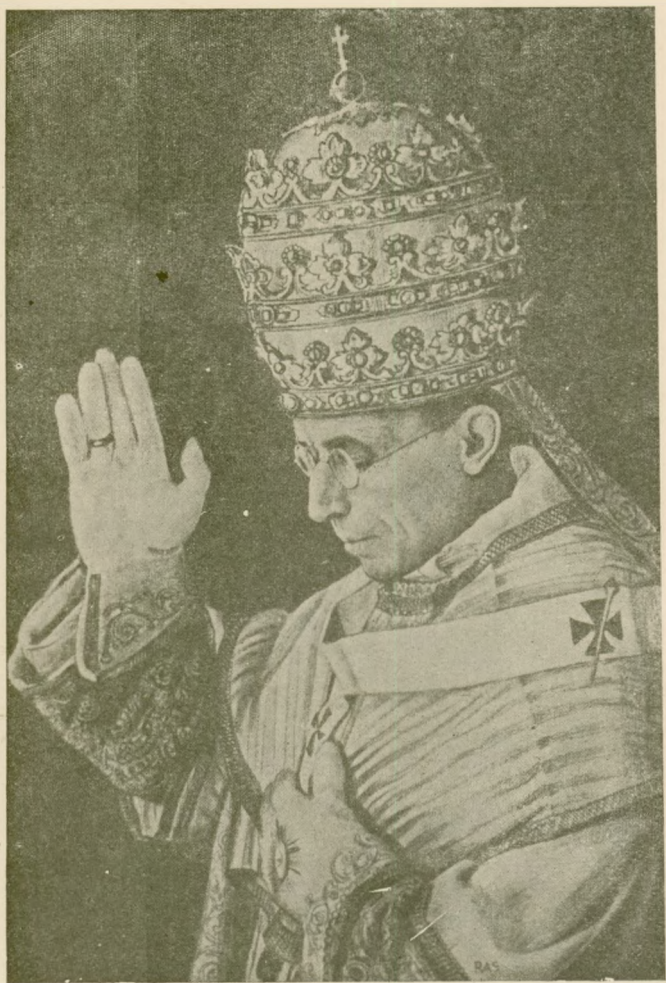
Sumo Pontífice Pío XII, felizmente reinante