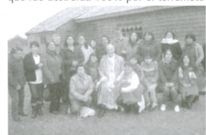
Comunidad de Reinaico, donde el Sr. Obispo, comenzó su Visita Pastoral, en agosto, a la Parroquia San Francisco de Parral. Allí se reunió también con las capillas de: Talquita, Perquillauquen, Monte Flor y los anfitriones.

Agradecemos el acompañamiento constante de nuestro sacerdotes, pues ellos siempre reforzaron cada iniciativa a favor de la reconstrucción y reparación de nuestros centros de Culto, como así también el apoyo de nuestro Obispo diocesano.