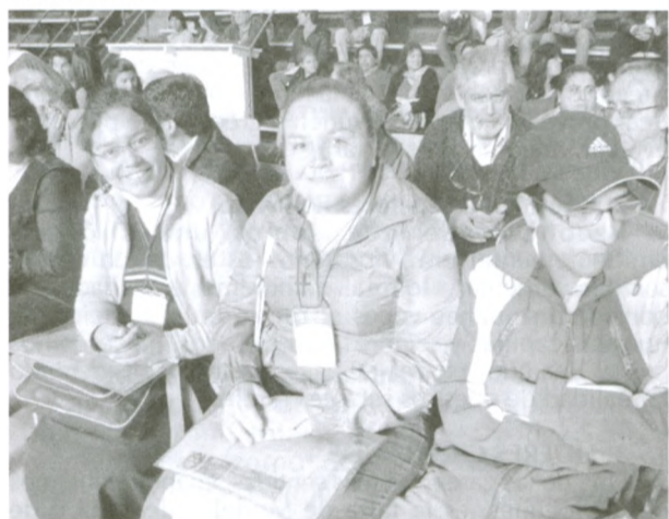
La alegría del reencuentro, de compartir la vida y la fe