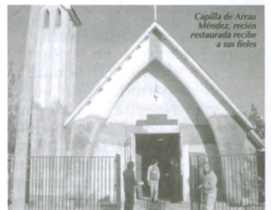
Capilla de Arrau Méndez, recién restaurada recibe a sus fieles.