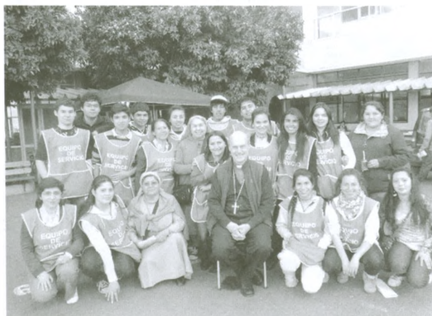
Equipo de servicio, siempre muy bien evaluados por los sinodales.

A partir de las 5 de la tarde del viernes 14 de octubre, en las dependencias del Instituto de Linares, luego de la bienvenida y de una once atendida por el eficiente y abnegado Equipo de Servicio , comenzó el XXXI Sínodo Diocesano. El lema escogido para este año fue “ Denles ustedes de comer ”, texto inspirador tomado de la multiplicación de los panes en San Juan 6, invitándonos a entrar en esta dinámica de pensar y actuar cómo podemos llevar el alimento que perdura para siempre a tantos y tantos jóvenes que lo necesitan.