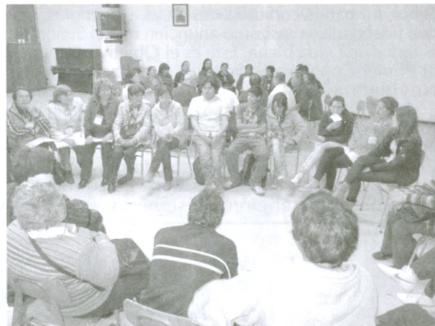
Trabajo por comisiones, en las que jóvenes, adultos y adultos mayores, trabajaron con respeto y comunión.

Luego fue el momento para el compartir en las familias que acogían a los sinodales y para otros para volver a sus hogares.