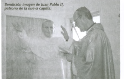
Bendición imagen de Juan Pablo II, patrono de la nueva capilla.