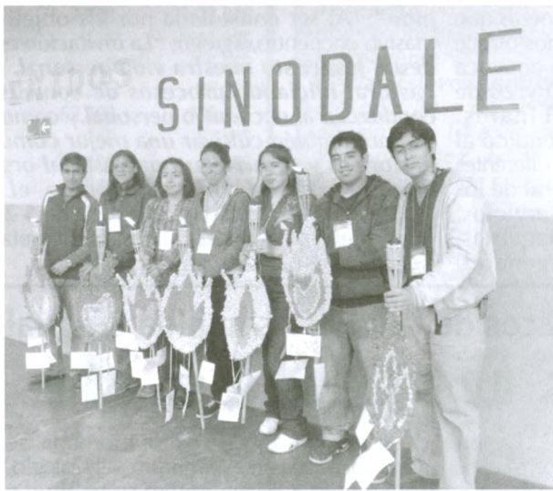
Jóvenes representando a cada decanato, en la bienvenida a la XXXI Asamblea Sinodal.

Esa tarde del viernes la dedicamos a profundizar en el “Documento Síntesis” el cual fue presentado de manera muy pedagógica -en un ambiente de oración- por el P. Rodrigo Osorio con el Equipo de jóvenes de Cauquenes.