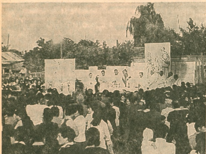
"En la Parroquia de Jesús Obrero, el Miércoles 23 de Noviembre."