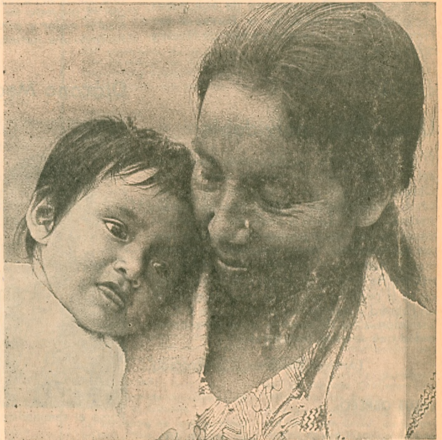
MILES DE MADRES DE FAMILIA DE LA ZONA UN DIA FUERON ALUMNAS DE LA ESCUELA DE LA PROVIDENCIA.

Tanto como la Iglesia. Siempre hemos tratado de mostrar la Providencia de Dios que tiene especial cariño por los pobres, los huérfanos y los abandonados. En esta línea nuestra escuela conserva el espíritu con el cual se fundó: atender a los de escasos recursos. Claro que en la manera de concretar este objetivo nos hemos transformado pro-